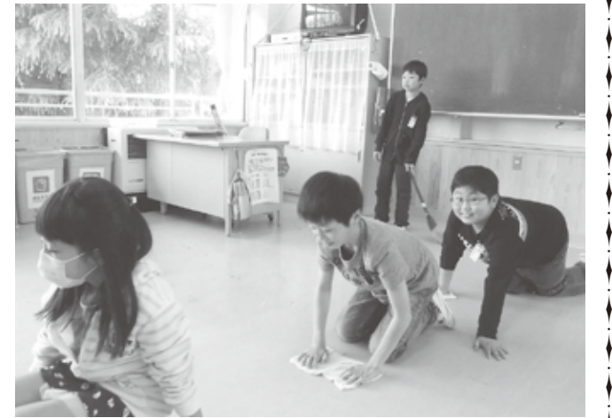
授業の中での歌唱活動

教科書(楽譜)を見ないで前を向き、表情良く歌えるようになると、今までとは違い、明るく響きのある歌声が音楽室いっぱいに広がります。子ども達は授業を通じてたくさん曲と出会い、コツコツと積み重ねながら歌唱力を高めていくのです。