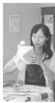
全校生徒が集う音楽朝会「歌い隊」の活躍

て同一音によるロングトーンを用います。また、学級・学年の息を揃えるために手拍子やリズム練習を行い、表情の確認ではマペットやアニメキヤラクターを用いて視覚を通じての授業も行っています。