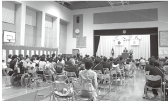
富士見特別支援学校