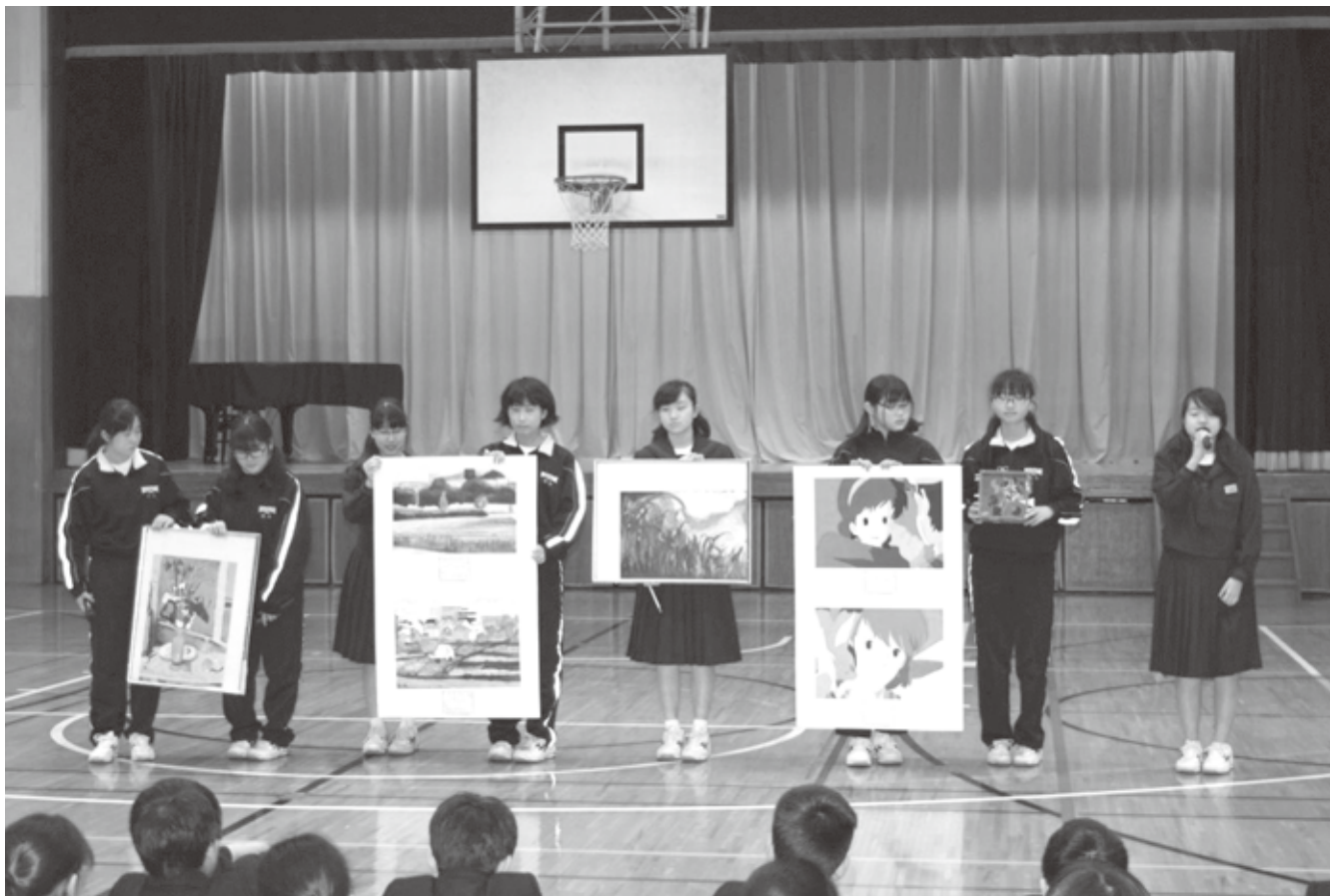
新入生歓迎会～部活動紹介・美術部～