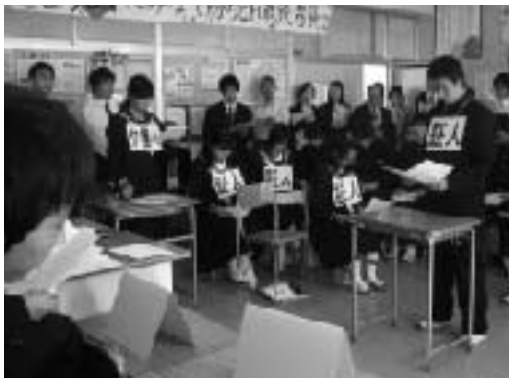
3年公民 公開授業 模擬裁判

昇降口で子供たちを見守る「あっくん・さっちゃん」。あいさつ運動のシンボルキャラクターです。「あっくん・さっちゃん」のように笑顔であいさつ頑張ろう！