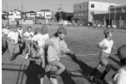
体力をつけて頑張るぞ

木曜日の朝、運動タイムに取り組んでいます。校庭が未完成で狭いため、校庭・体育館・オープンスペースの3つの場所に分かれ、それぞれの場所に合った運動をしています。