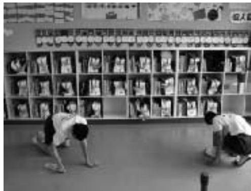
美しい教室で落ち着いた生活

東中学校では、毎学期末に生活の様子を振り返り自己評価をしています。その反省を生かしロッカーの整理整頓キャンペーン等で意識を高め、美しい教室環境を保っています。