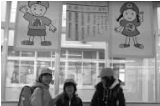
「あっくん・さっちゃん」がお出迎え

東中学校では、毎学期末に生活の様子を振り返り自己評価をしています。その反省を生かしロッカーの整理整頓キャンペーン等で意識を高め、美しい教室環境を保っています。