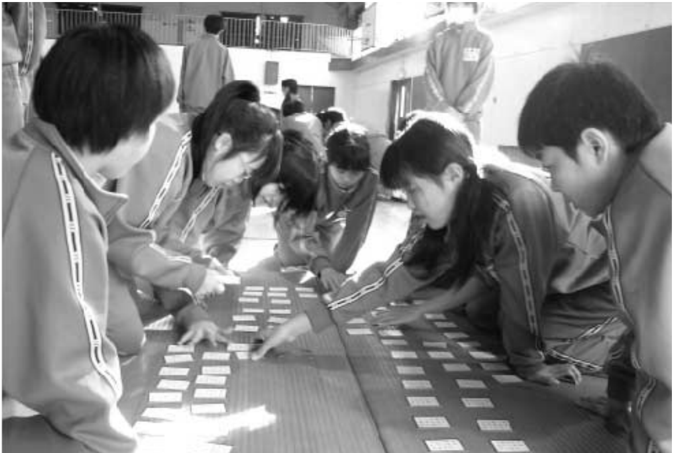
「いにしえの～」 「はい！」 —百人一首大会—