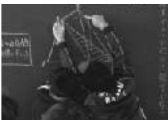
P93 三角形の合同条件 △ABCと合同な三角形を書けよう。