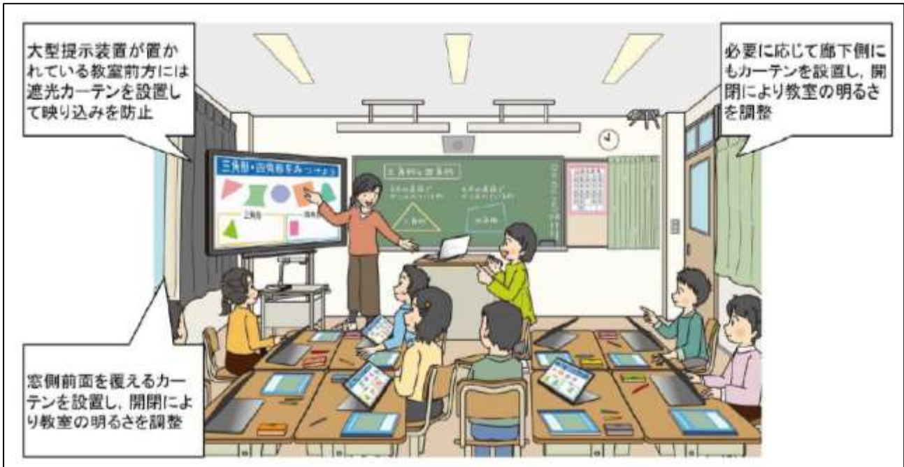
図1 教室の明るさに関する留意事項