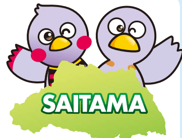
さいたまっち コバトン