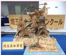
小学生低学年の部