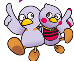
コバトン さいたまっち