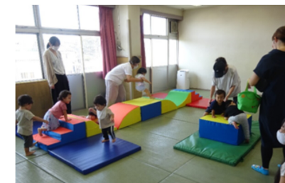
室内遊具で楽しく遊ぶ

誰かの歌の歌詞に“笑顔が笑顔を連れてくる”とあります。笑顔で皆さんをお待ちしています！