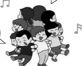
おしくらまんじゅう