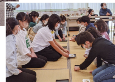
（右）つるせ台ひろば 3月のミニ茶道教室