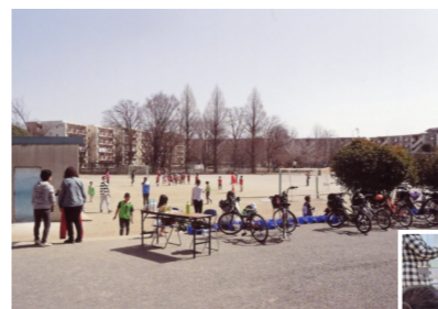
（左）関沢キッズクラブ 3月のサッカー教室

富士見市地域子ども教室は、子どもたちが安心して活動できる「居場所」を創るために開始されました。さまざまな体験や異年齢・異世代間交流などを通して多くのことを学び、社会性・自主性・創造性を育むことを目的として実施しています。各小学校ごとに設置されています。