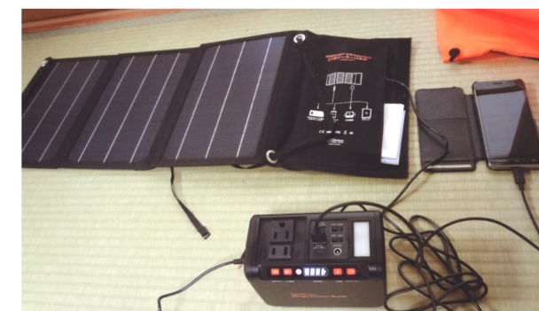
簡単なソーラー発電機。携帯の充電には便利。80ワット位までの交流電気器具の電源として使える。