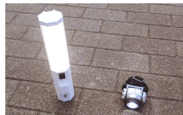
左は乾電池式のライト。3段階に明るさが変わり、後ろに磁石がついているので冷蔵庫などにつけられる。右はLEDヘッドライト。スイッチで点灯の仕方が変わります。