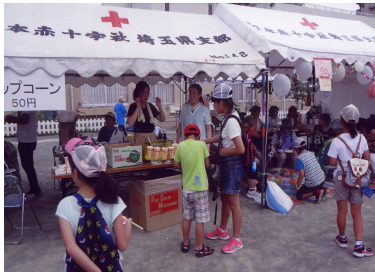
学校と地域が一緒になってつくる第1回 つるせ台まつり開催(126号 2017年10月)