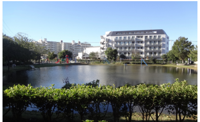
台風19号の時、つるせ台公園が池になる これからの異常気象が心配される(148号 2019年12月)