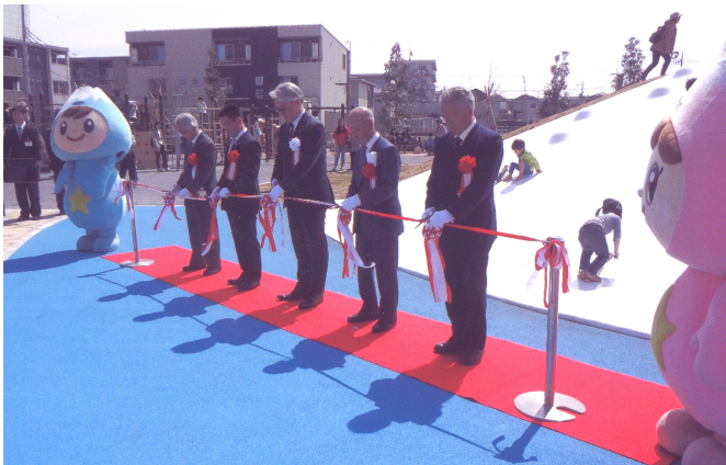
公園の少ない地域に待望のゆうゆうの丘公園が オープン(132号 2018年5月)