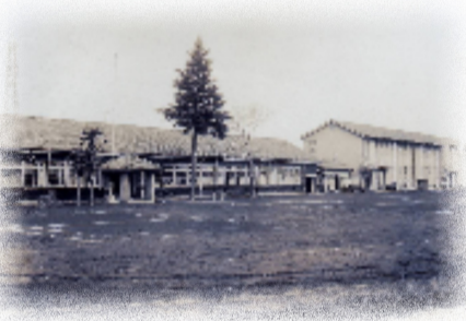
昭和39年3月の水谷小学校

水谷小学校は、明治5年小学校発布の趣旨に従い、明治6年11月23日に開校された市内で最も歴史と伝統のある学校の一つです。三村当時の学校の敷地は、砂利道の公道と学校敷地の間は土手で仕切られていて、境界のフェンスもなく、今では考えることのできない開放感のある環境でした。道路側には、並行して桜の木が植えられ、入学式の頃には歓迎の花を咲かせていました。現在は、道路の拡張や歩道整備、