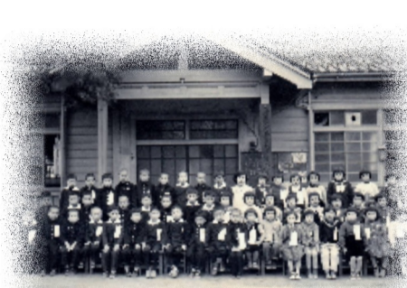
昭和33年入学時の風景

老木化などにより、少し寂しくなったような気がします。合併当時、南側にかなり年季の入った木造平屋建ての校舎、その前にはプラタナスの木、北側には二階建ての校舎があり、かなり年季の入った建物でした。学年1、2クラス編成の児童がのびのびと健やかに学んでいました。先人たちが残した歴史や伝統は、現在に引き継がれています。そして、令和5年には創立150年という節目の年を迎えます。