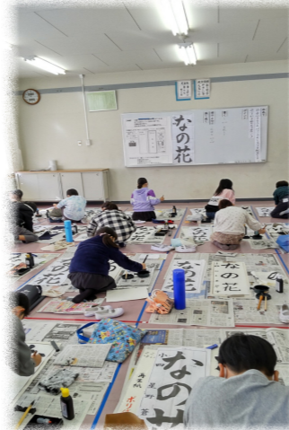
小学4年生の書初めの様子