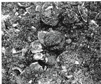
▲貝塚の中から出てきた木の実