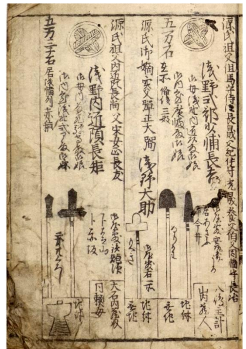
貞享武鑑 左が浅野内匠頭の記事。下に大石内蔵助の名がみえる(貞享元・1684年刊)