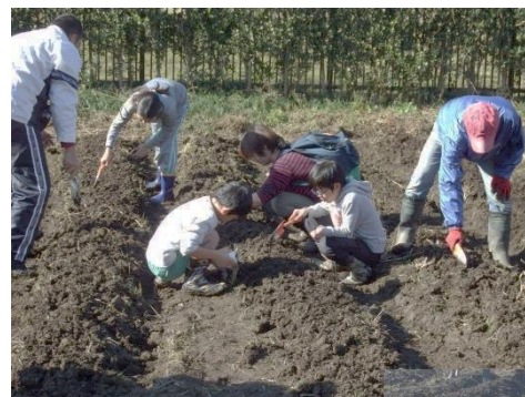
子どもも大人も一生懸命！