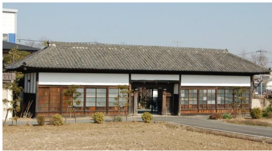
大澤家長屋門(平成 19 年) 部屋が設けられているのが分かる