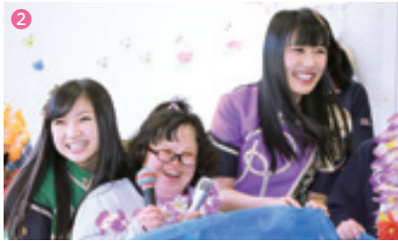
①第五保育所の子どもたちと。 ②ゆいの里の利用者と。