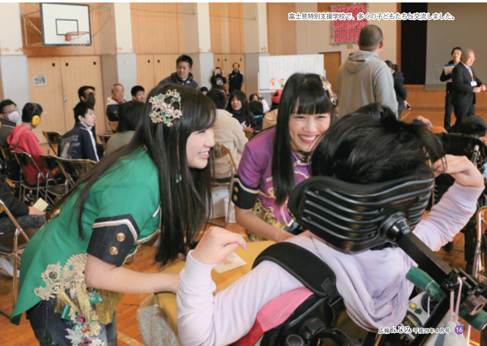
富士見特別支援学校で、多くの子どもたちと交流しました。