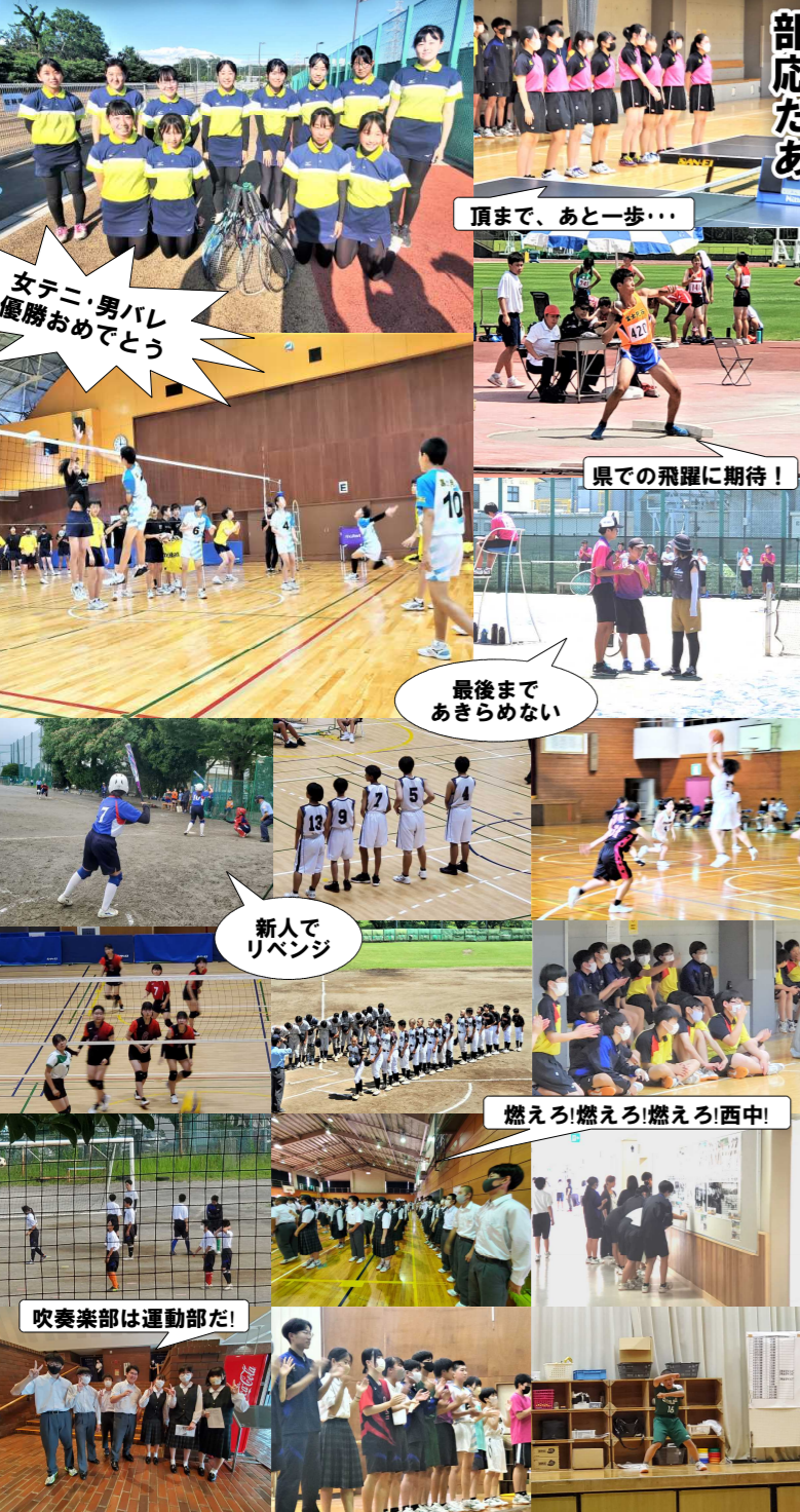
女テニ・男バレ 優勝おめでとう