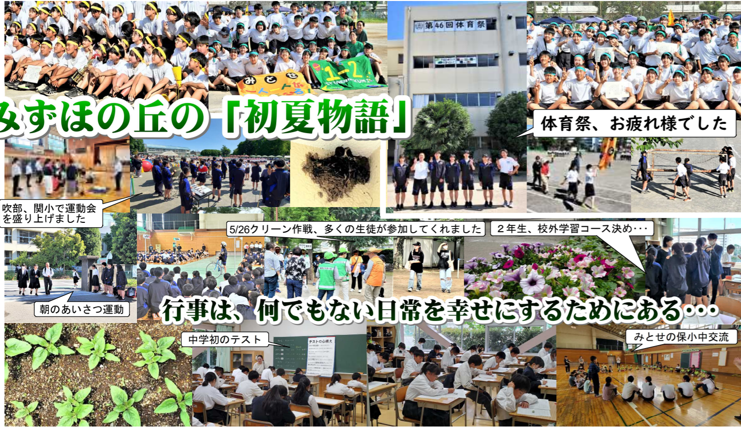
体育祭、お疲れ様でした