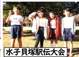
水子貝塚駅伝大会