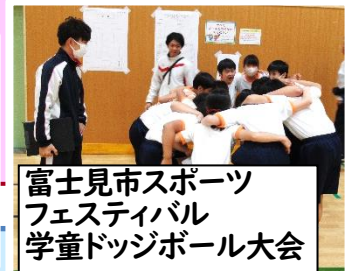
富士見市スポーツフェスティバル 学童ドッジボール大会