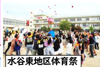
水谷東地区体育祭