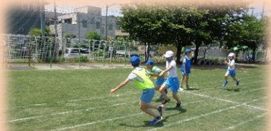
芝生の校庭で楽しくリレー(6年)

5月の個人面談では、ご多用の中、たくさんの保護者の皆様にご来校いただき本当にありがとうございました。