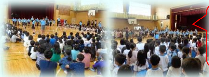
音楽会を朝会 で歌って

今月もつるせ台小学校の教育活動へのご理解ご協力をどうぞよろしくお願いいたします。