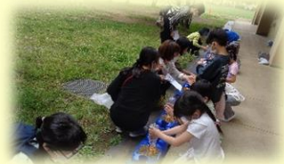
一緒に朝顔の種まき(1年)