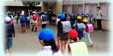
あいさつ運動のようす

さて、先日の学校朝会で「あいさつで心を育てよう」という話をしました。5・6年生のあいさつ名人から、「気持ちがすっきりする」「相手の気持ちをよくする」などあいさつの効果を教えてもらいました。そして、「おはよう」「ありがとう」「ごめんなさい」などのあいさつは、自分の心を大きく育てることをみんなで確かめました。本校の重点生活目標は「会った人に、あいさつで気持ちを伝えよう」ですが、笑顔であいさつできる子がどんどん増えています。これからもあいさつの合言葉「 明るく、いつも、先に、伝えて 」を大切にして、学校ではもちろん、家庭・地域でも気持ちのよいあいさつができるようにしていきます。これからも学校は、子どもたちのよい姿で教育の成果をお見せできるように指導していきます。