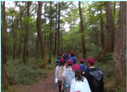
青木ヶ原樹海をハイキング

保護者の皆様には、林間学校に向けての準備や当日のお弁当づくり、行きと帰りのお見送り・お迎えで大変お世話になりました。子どもたちがかけがえのない思い出をつくれたのも皆様のおかげです。本当にありがとうございました。