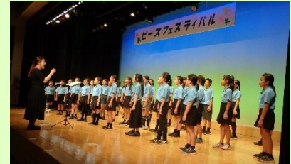
心を1つに、歌声魂で熱唱する児童

実は、本校には「継続は力なり」のお手本となる子どもたちがいます。それは、「合唱部のみなさん」です。合唱部のみなさんは、4月から休み時間や放課後、土曜日と一生懸命に練習に励んできました。この夏休みは、終業式から8月9日まで、17日から19日まで、毎回3時間程度の練習で力を高めてきました。コンクールでは、素晴らしい成績を収めました。