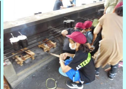
みんなで楽しく美味しいカレーづくり