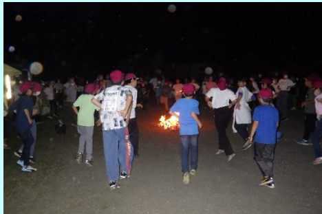
友達と楽しく踊ったキャンプファイヤー