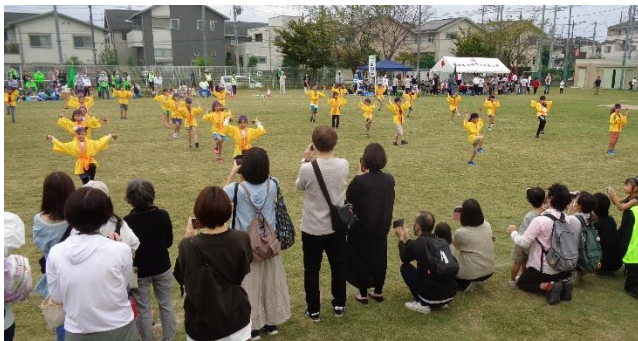
地区体育祭でよさこいを披露

本校では、子どもたちのよい姿を保護者・地域の皆様にお見せすることを意識して取り組んでいます。皆様のあたたかいご支援のおかげで、子どもたちがのびのびと育っています。いつも応援、本当にありがとうございます。