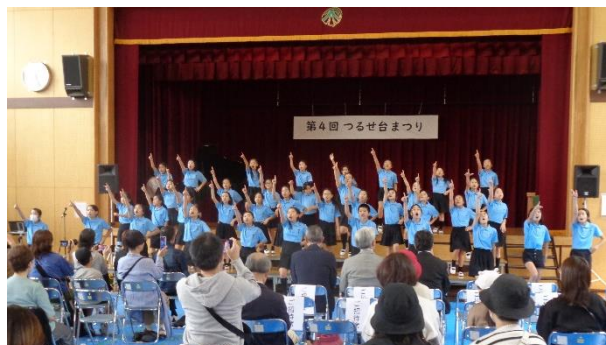
つるせ台まつりで合唱部が演奏