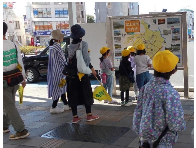
2年生の町たんけんて児童の安全を見守る

子どもたちが安心して学ぶには、保護者の皆様のおあたたかい見守りが大切です。子どもたちの活動がどんどん主体的に変容しています。本当にありがとうございました。