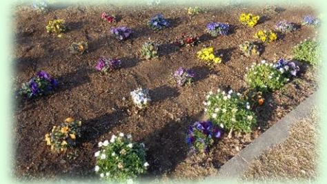
春を待つみんなで植えた花々

2月も教職員一同、子どもたちのために全力で指導に当たって参ります。そして、暖かい春、希望の春へと一歩ずつ確実に歩みを進めていきます。保護者、地域の皆様、今月もつるせ台小学校の教育活動にご理解とご協力をよろしくお願いいたします。