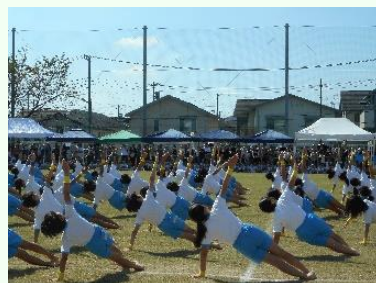
つるせ台ニシンピック