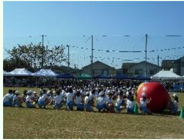
運べ！転がせ！大だんご！ みんなでわっしょい、パンプキン