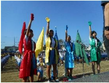
4つの団の選手宣誓

10月12日(土)、青空の下、運動会が行われました。芝生の校庭で思いっきり楽しみ、素敵な笑顔が溢れていました。