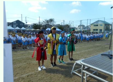
みんな、頑張りました！！