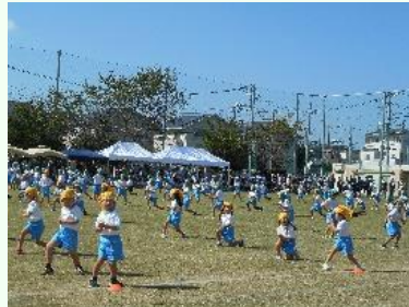
つるせ台★カラフルにんじゃ