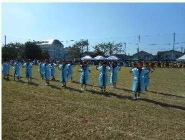
つるせ台よさこい2024