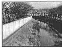
砂川堀の かさ上げ 工事実施!!