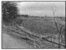
柳瀬川の 水谷調節池 工事に着手!!