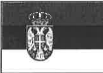
東京2020 オリンピック ・パラリンピック 事前キャンプ 誘致!!