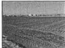
チャレンジする 認定農業者に 対する補助制度 の創設!!