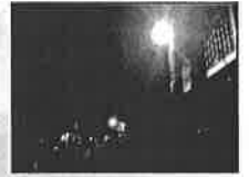
全ての防犯灯が LED化!!