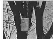
ムクドリ追い出し 装置の設置数 増加!!