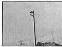
防犯カメラの 普及!!