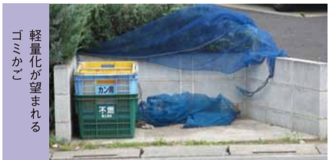
軽量化が望まれる ゴミかご