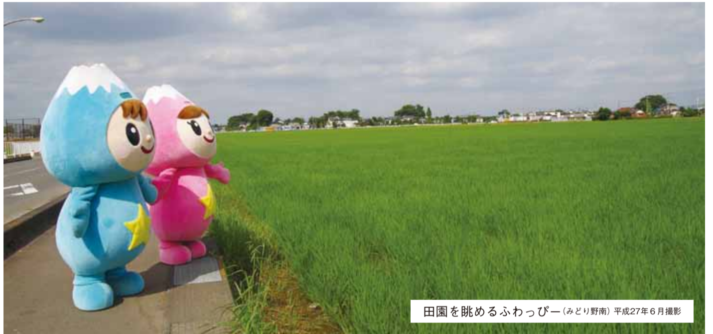
田園を眺めるふわっぴー(みどり野南)平成27年6月撮影