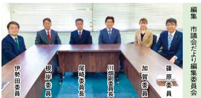
編集 市議会だより編集委員会

富士見市議会だよりは、昭和58年4月発行の第28号から現在まで38年間にわたり、総務常任委員会の所管として編集作業を行ってまいりましたが、今号から専門的な組織として、「市議会だより編集委員会」を設置して、編集作業を行うことになりました。今後、紙面の見直しを含め、見やすく、分りやすい市議会だよりの発行に努めてまいりますので、市民の皆さまのご理解・ご協力をよろしくお願いたします。お気づきの点がございましたら本委員会までお寄せください。