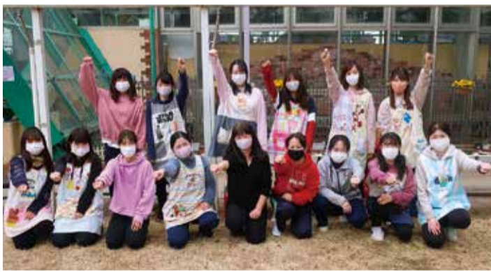
きたはら幼稚園のみなさん

A コロナ禍で大変ではありますが、大人が暗い顔だと子ども達は元気になれないので、笑顔を忘れないようにしていきたいですね。