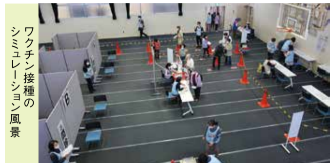
ワクチン接種のシミュレーション風景