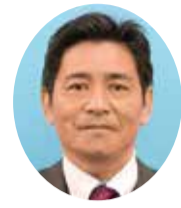
川畑 勝弘 (日本共産党)