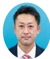
副議長 今成 優太