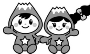
富士見市マスコットキャラクター 「ふわっぴー」

富士見市役所 政策財務部 政策企画課 直通電話 049-257-4136 代表電話 049-251-2711(内線 232) FAX 049-254-2000