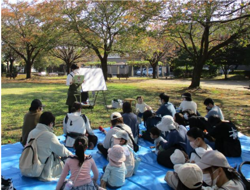
屋外での読み聞かせ