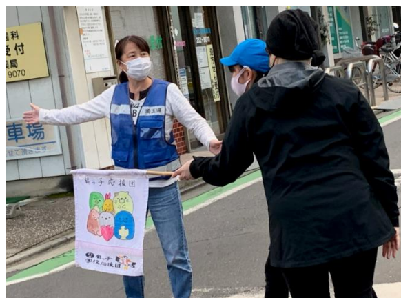
登下校時の見守り