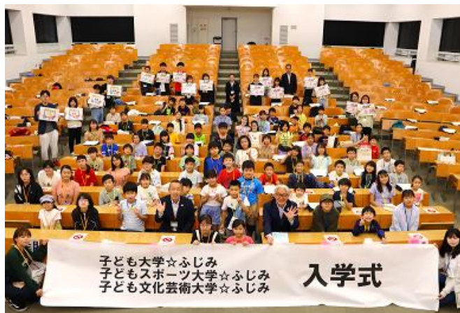
子ども大学☆ふじみ