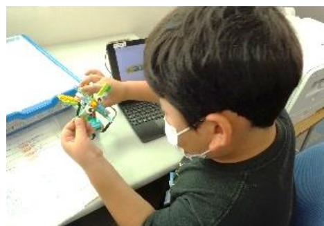
レゴを使ったプログラミング教育