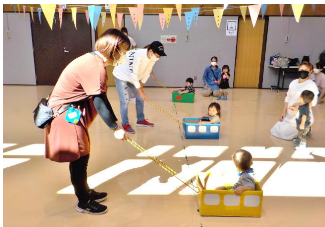
子育てサロン「ちびっこあおむし」