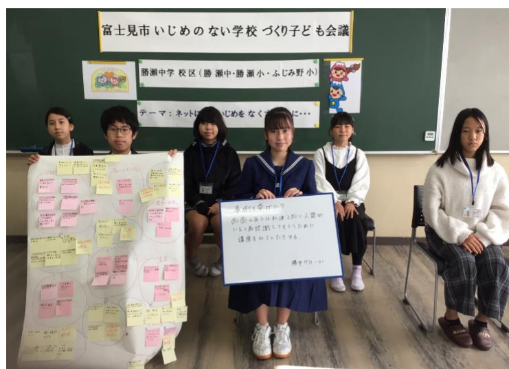
いじめのない学校づくり子ども会議