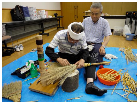
ほうき作り伝承会活動