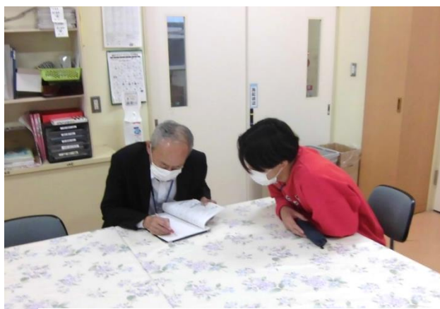
若手教員育成指導員による育成・指導