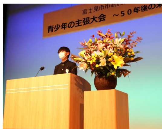
青少年の主張大会