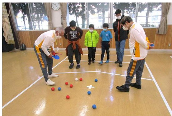
ボッチャの体験会

(10) ボッチャ 46 の体験会を開催するなど、障がいの有無や老若男女を問わず誰でも楽しめるスポーツ活動を推進します。