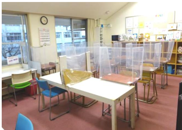
教育支援センター「あすなろ」