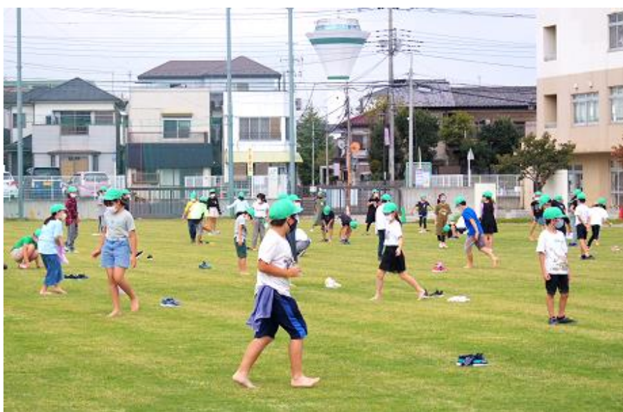
つるせ台小学校校庭