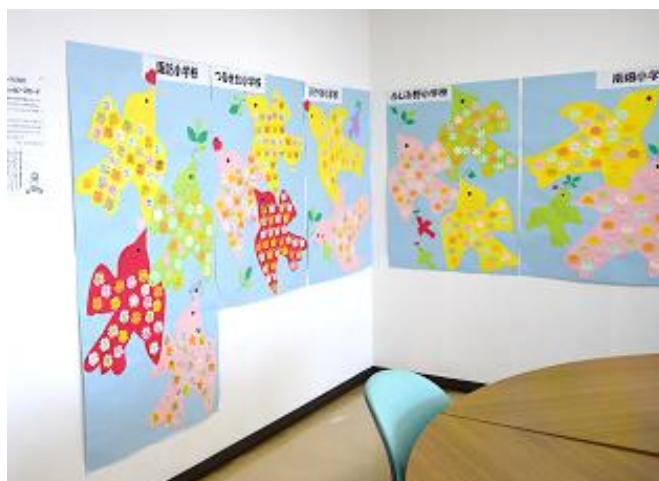
小学6年生による平和への想いを込めたメッセージをピースフェスティバルにて展示

(2) 富士見市非核平和都市宣言の理念を多くの市民に広めるため、平和・憲法啓発事業としてピースフェスティバルを開催します。また、小学校の社会科授業に戦争体験のある市民話者などを派遣し、子どもたちに戦争の悲惨さを伝え、いのちの大切さを学ぶ機会をつくれます。