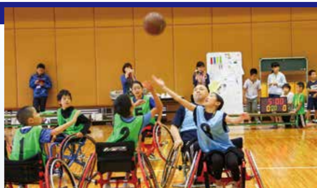
子どもスポーツ大学☆ふじみ(H30年度開催の車いすバスケット)