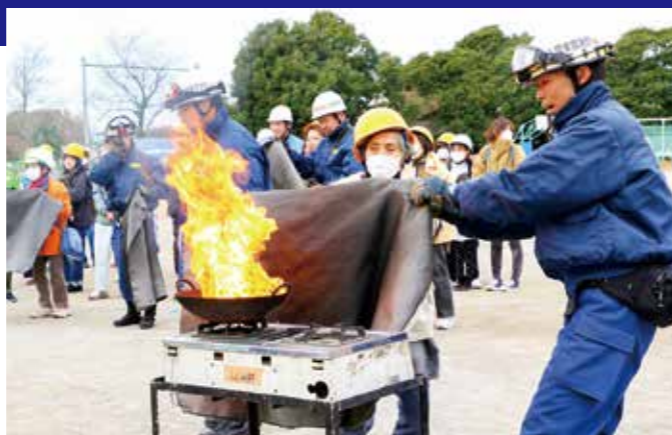
総合防災訓練の実施(写真は水谷東地区の防災訓練)