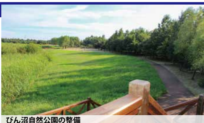
びん沼自然公園の整備

市内産青梅を使用した富士見ブランドの梅酒「梅恋花」などの製造・販売やPRを支援します。また、梅恋花の製造本数を増やします。