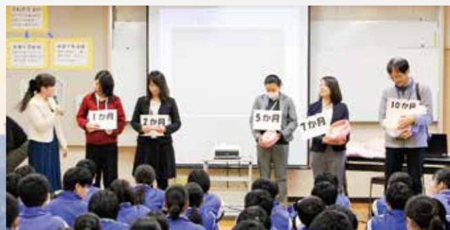
いのちの大切さはぐくむ授業