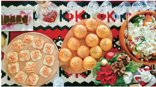
バリエーション豊かなセルビア料理 (参考)