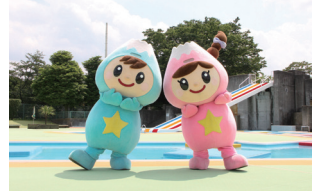
富士見市マスコットキャラクター ふわっぴー