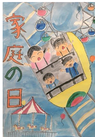
5・6年生の部 木内 日菜さん