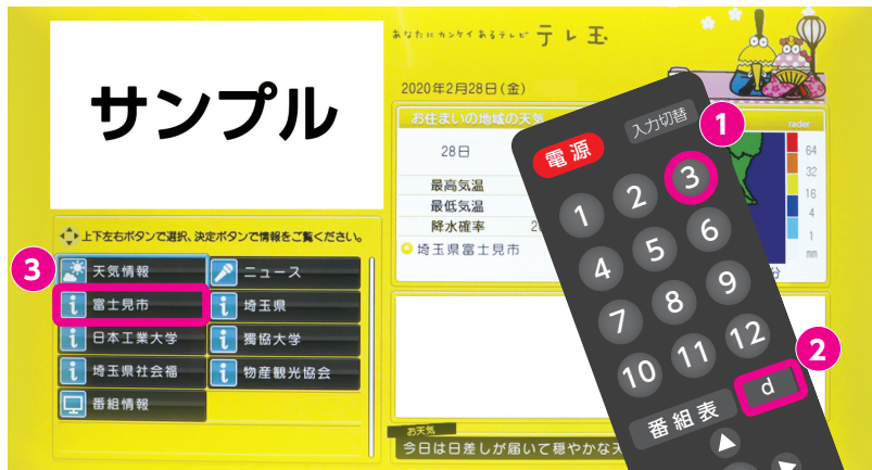
テレ玉市町村データ放送サービス画面(イメージ)