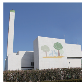
富士見環境センター