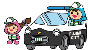
富士見市マスコットキャラクター ふわっぴー

電話が繋がらない場合も多くあるので、事業者に連絡した証拠を記録しておきましょう。