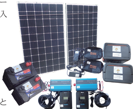
ソーラーパネルとポータブル電源

シティヴェールふじみ野自主防災組織では、宝くじの助成金を受け、災害時に電源を確保するためのソーラーパネルとポータブル電源を購入しました。