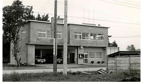
福岡町消防本部・消防署開署時の庁舎

これからも、多様化する各種災害に対応するため、体制の強化と地域の防災力向上に努めていきます。