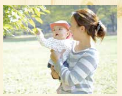
拡充される母子への支援