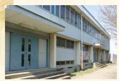
空調設備の整備を予定している学校体育館