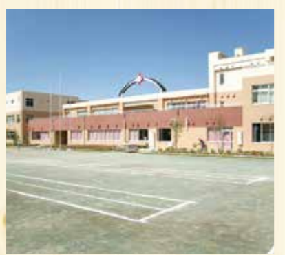
つるせ台小学校の校庭