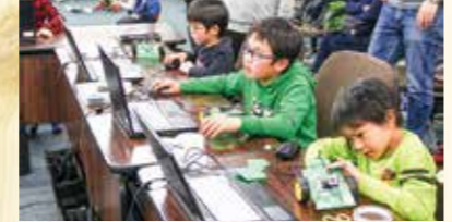
プログラミングなどから論理的思考力などを高めるSTEM教育