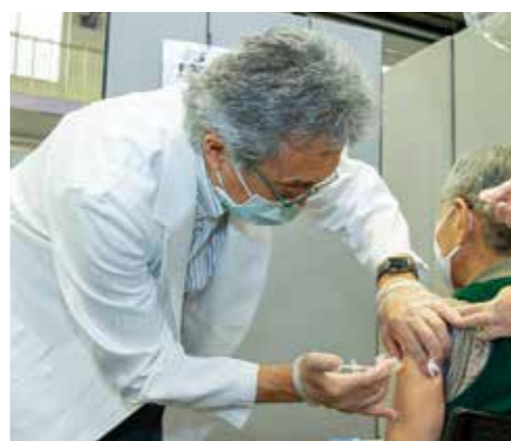
集団接種会場で接種を行う日鼻医師

切だと考えているのは、接種体制の整備とともに、各方面とのコミュニケーションの深化です。集団接種会場・個別接種会場問わず、接種はチームで進めていくものです。医師、看護師、現場の係員に加え、市内各医療機関、行政を一つのチームとして機能させることで、安全面・効率面ともに向上させていきたいと考えています。