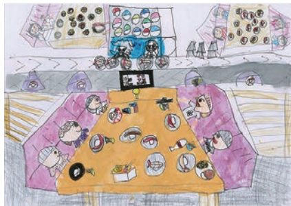
1・2年生の部最優秀賞 菅原 美弥

なお、入賞作品は「家庭の日」のポスターに使用され、市内公共施設や学校などに掲示されます。