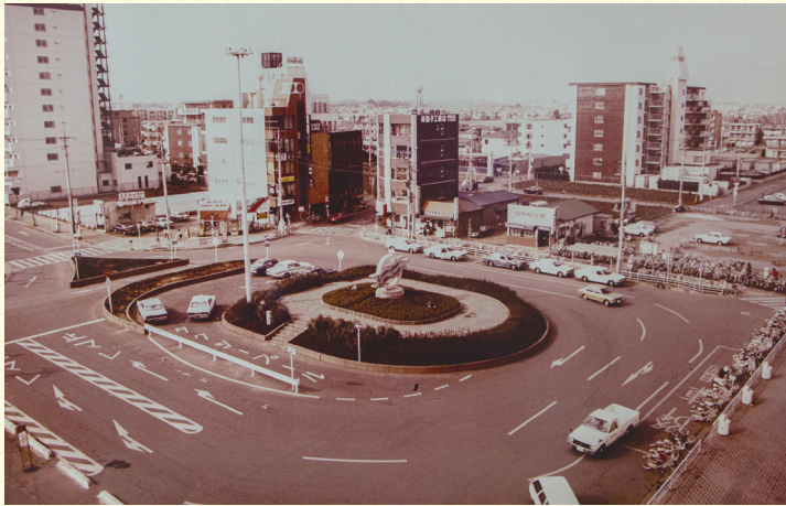
開設後間もないころのみずほ台駅西口

昭和47年4月10日に町から市へと発展した当時は、急激な人口増加にあわせて多くの学校や公民館が建設されました。また、市制施行から5年後の昭和52年にはみずほ台駅が開設されるなど、現在の市民生活の基礎が築かれていきました。