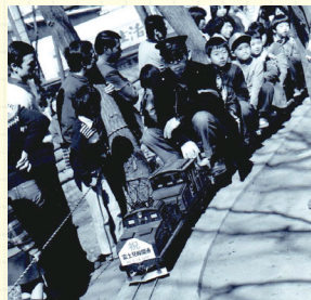
ミニ鉄道が走るむさし野緑地公園ができたのは昭和55年のこと

むさし野緑地公園で活動する当クラブも発足から40年余り。発足当時に一緒にミニ鉄道に乗った子が親になって子連れでミニ鉄道に乗りに来てくれるのが、とても感慨深いです。