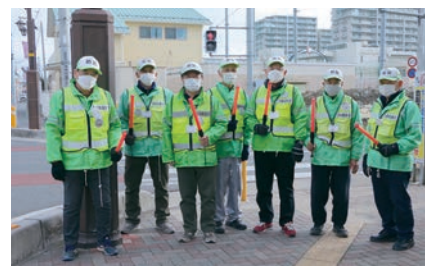
通学路で見守り活動を行うつせ台小学校区の町会の皆さん