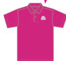
プリントイメージ