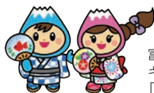
富士見市マスコットキャラクター「ふわっぴー」

7月28日(木)・30日(土)10:00～11:30/市民福祉活動センターぱれっと/小学生以上/みんなで楽しく茶道を学びます/1回300円(1回だけの参加も可)/主催瑞順庵/田中 ☎049-253-5210