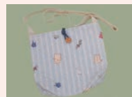
ショルダーバッグ (19×18cm)