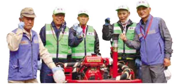
渡戸3丁目町会防災会の皆さん