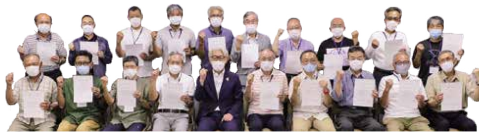
富士見防災リーダー養成講座 修了者の皆さんと星野市長