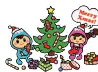
富士見市マスコットキャラクター「ふわっぴー」

掲載は受付順です。原則として掲載月の前々月の25日(25日が土・日・祝の場合はその前日)までにお申し込みください。