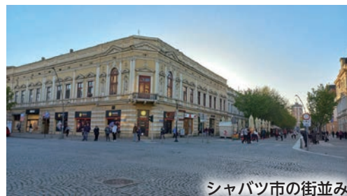
シャバツ市の街並み