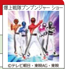
爆上戦隊ブンブンジャー ショー