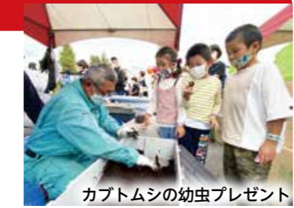
カブトムシの幼虫プレゼント