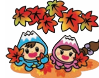
富士見市マスコットキャラクター「ふわっぴー」

ボーイスカウト富士見1団 / ボーイスカウトとあそぼう! ワクワク自然体験あそび(文部科学省後援) 11月24日(日)9:30~12:00 野営場(下鶴馬氷川神社のとなり) 年中~小学生の男女 テント張り、野外ゲーム、マシュマロ焼きほか 25人程度 「ボーイスカウトとあそぼう! ワクワク自然体験あそび」で検索し、「埼玉、富士見1団」から1人ずつ申し込み 活動説明会 12月開催予定 家庭や学校では学ぶことのできないボーイスカウトの活動について 入会金3,000円・月会費1,000円 氏家 ☎049-252-0931