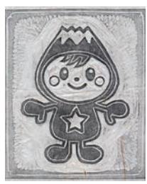
たくほんの作品例